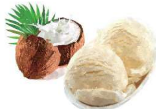
COCONUT ICE CREAM ココナッツアイスクリーム