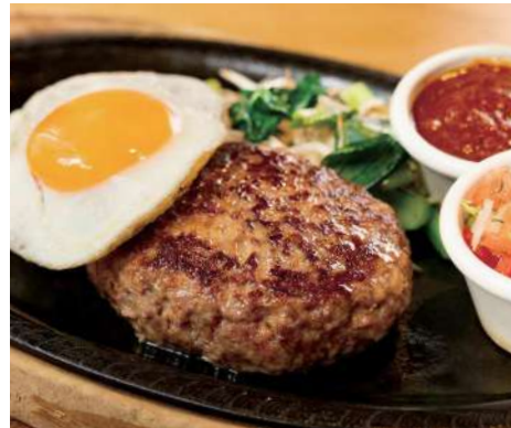
C. THE HAMBURG STEAK WITH RICE ハンバーグステーキ ライス付 DEMIGLACE SAUCE OR TOMATO SALSA デミグラスソース or トマトサルサ