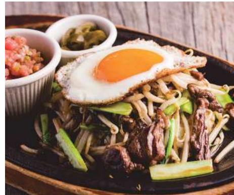
G. ZEST BEEF JAMBALAYA ゼスト風ビーフジャンバラヤ