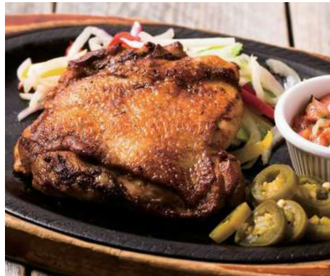
B. SPICY CHICKEN & VEGGIE "FAJITA" スパイスの効いたチキンと野菜の 鉄板焼き“ファフィータ” RICE OR TORTILLAS ライス or トルティーヤ