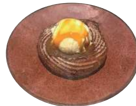
HOMEMADE CHURROS & VANILLA ICE CREAM 自家製チュロス&バニラアイス キャラメルソース