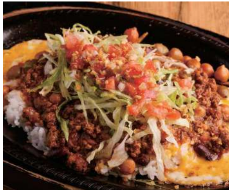
F. GRILLED CHEESE TACO RICE 鉄板焼きチーズタコライス