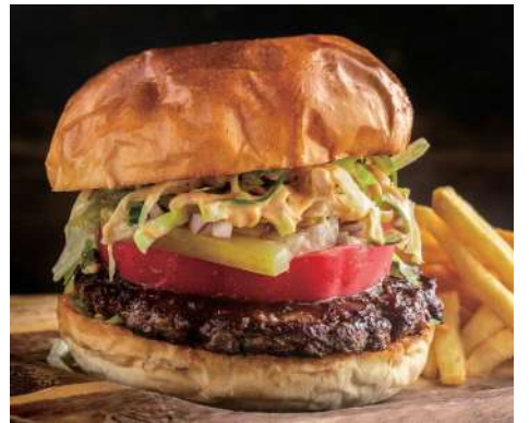
D. ZEST BURGER (WITH FRENCH FRIES) ゼストバーガー (フライドポテト付) +¥200(税込220)