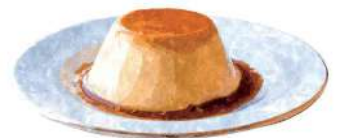
MEXICAN PUDDING メキシカンプリン