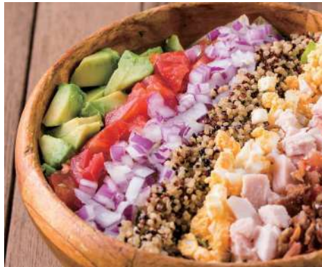
E. MEXICAN COBB SALAD メキシカンコブサラダ