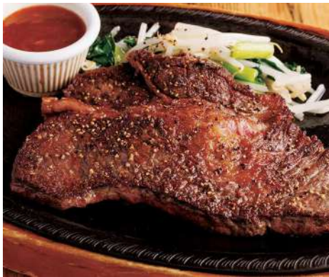
A. US BEEF STEAK WITH RICE USビーフステーキ ライス付 +¥500(税込550)