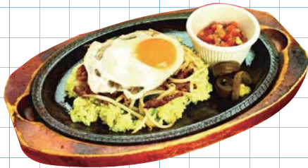
Zest Beef Jambalaya ゼスト風ビーフジャンバラヤ