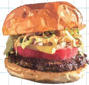
Hamburger ハンバーガー Zest Double Burger ゼストダブルバーガー +200yen