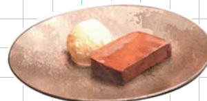
Chocolate Terrine チョコレートテリーヌ