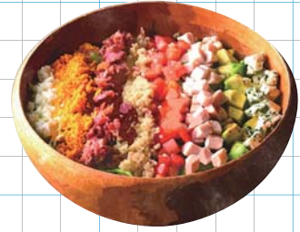
Cobb Salad コブサラダ