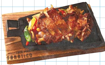
Fajita Chicken (Rice or Tortillas) ファフィータチキン (ライス or トルティーヤ)