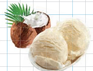
Coconut Ice Cream ココナッツアイスクリーム