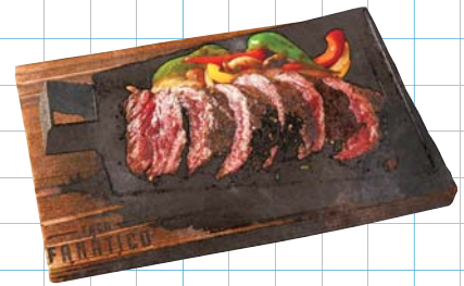
U.S. Prime Beef Hanger Steak (Rice or Tortillas) U.S.プライムビーフハンガーステーキ +550yen (ライス or トルティーヤ) 最高品質プライムビーフのハラミを使用しています